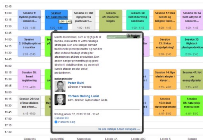
Figur 3 Sessioner fordelt på lokaler. Mouse over viser information om den enkelte session.

I figur 3 ses en visning, hvor sessioner i et gitter er fordelt på lokaler. Der er også mulighed visning af sessioner pr. lokale eller en detaljeret visning, hvor hele programmet foldes ud. En mouse-over giver en pop-up med detaljeret information om sessionen.